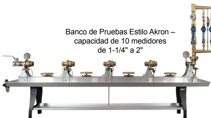
Banco de Pruebas Estilo Akron – capacidad de 10 medidores de 1-1/4" a 2"