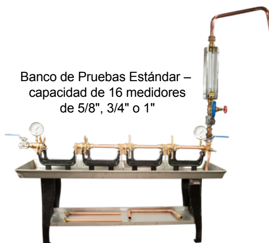
Banco de Pruebas Estándar – capacidad de 16 medidores de 5/8", 3/4" o 1"

También disponible: Banco de Combinación Indianápolis/Akron, lo cual conserva el espacio en el taller de medidores por la posibilidad de probar cada tamaño de medidor hasta 2" en un solo banco.